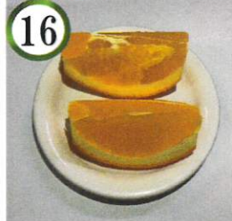
オレンジ【オレンジ】