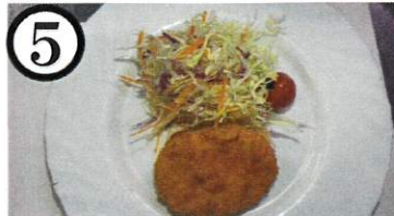
ポテトコロッケ【小麦,乳,大豆,卵】