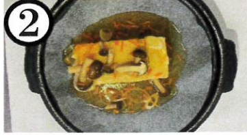
揚げだし豆腐【大豆,小麦,鯖】