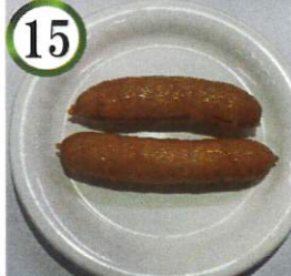
ポークウィンナー【豚肉】