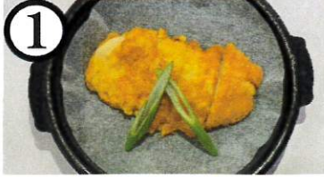
チキンピカタ【鶏肉,卵,乳】