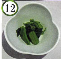
ほうれん草のお浸し