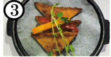
焼きさつま揚げ【卵,大豆,鯖】