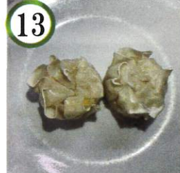
コーンシュウマイ 【豚肉,小麦,大豆】