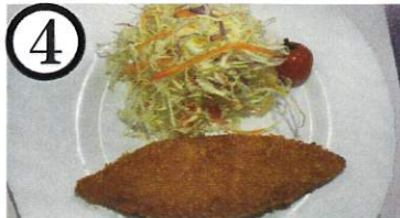
白身フライ【大豆,小麦】